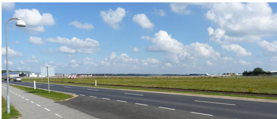
Billund Lufthavn set fra Båstlundvej

Miljøredegørelsen skal give en samlet beskrivelse af projektet og dets miljøkonsekvenser, som kan danne baggrund for såvel en offentlig debat, som den endelige beslutning om projektets gennemførelse.